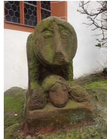
Skulptur vor dem Kloster Höchst im Odenwald, um 1200, Fotos: Jan Christensen

Sehen Sie sich den Gesichtsausdruck des Lammes an! Welche Ruhe und Sicherheit. Offensichtlich war die Bibelkenntnis im Jahr 1200 besser als heute, wenn wir den Titel hören.